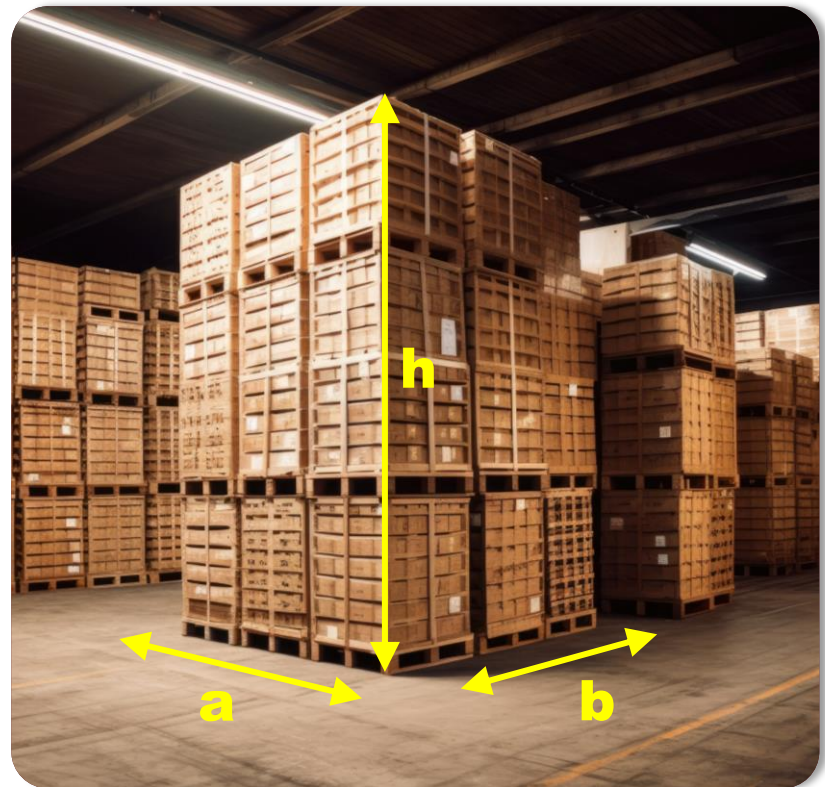
Apilamiento en "bloque"

Debe utilizarse siempre la menor dimensión (b) de la base de la pila o bloque.